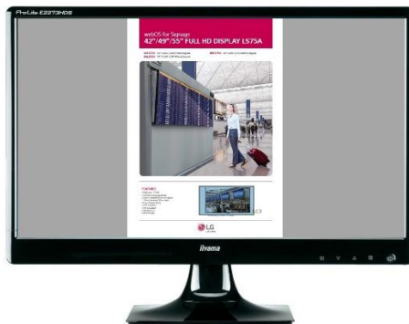
Afbeelding 1; beeldvullende zone met 1 X A4

Het formaat van uw document moet enigszins overeenkomen met de zone indeling van uw beeldscherm. Stel, u heeft een beeldscherm in Landscape en een A4 PDF bestand, dat u wilt gaan plaatsen. Het resultaat zal dan zijn, zoals hieronder in afbeelding 1 is weergegeven.