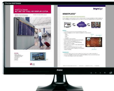
Afbeelding 2: twee zones verdeeld over uw beeldscherm.

De grijze vlakken zijn in principe lege delen. De kleur daarvan wordt bepaald in de player instellingen. In afbeelding 2 zijn twee zones gemaakt. Elke zone is afzonderlijk te beheren.