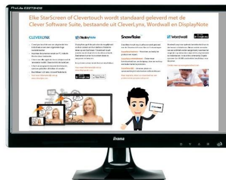
Afbeelding 4: één zone beeldvullend

In afbeelding 4 is een liggend formaat PDF toegepast. Dit formaat is het meest toegepast, omdat het aansluit bij de beeldverhoudingen van de monitor met een beeldvullende zone. De PDF publicatie kan zo gemakkelijk onderdeel zijn van een complete Myeasychannel presentatie met meerdere objecten zoals video, afbeeldingen en tekstpagina's.