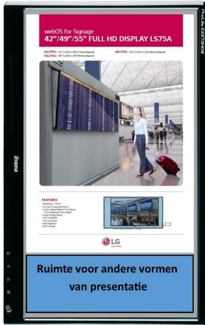
Afbeelding 5: Portrait toepassing

Als u veel in het A4 formaat werkt, is een Portrait opstelling ook één van de mogelijkheden. In afbeelding 5 ziet u een mogelijke toepassing.